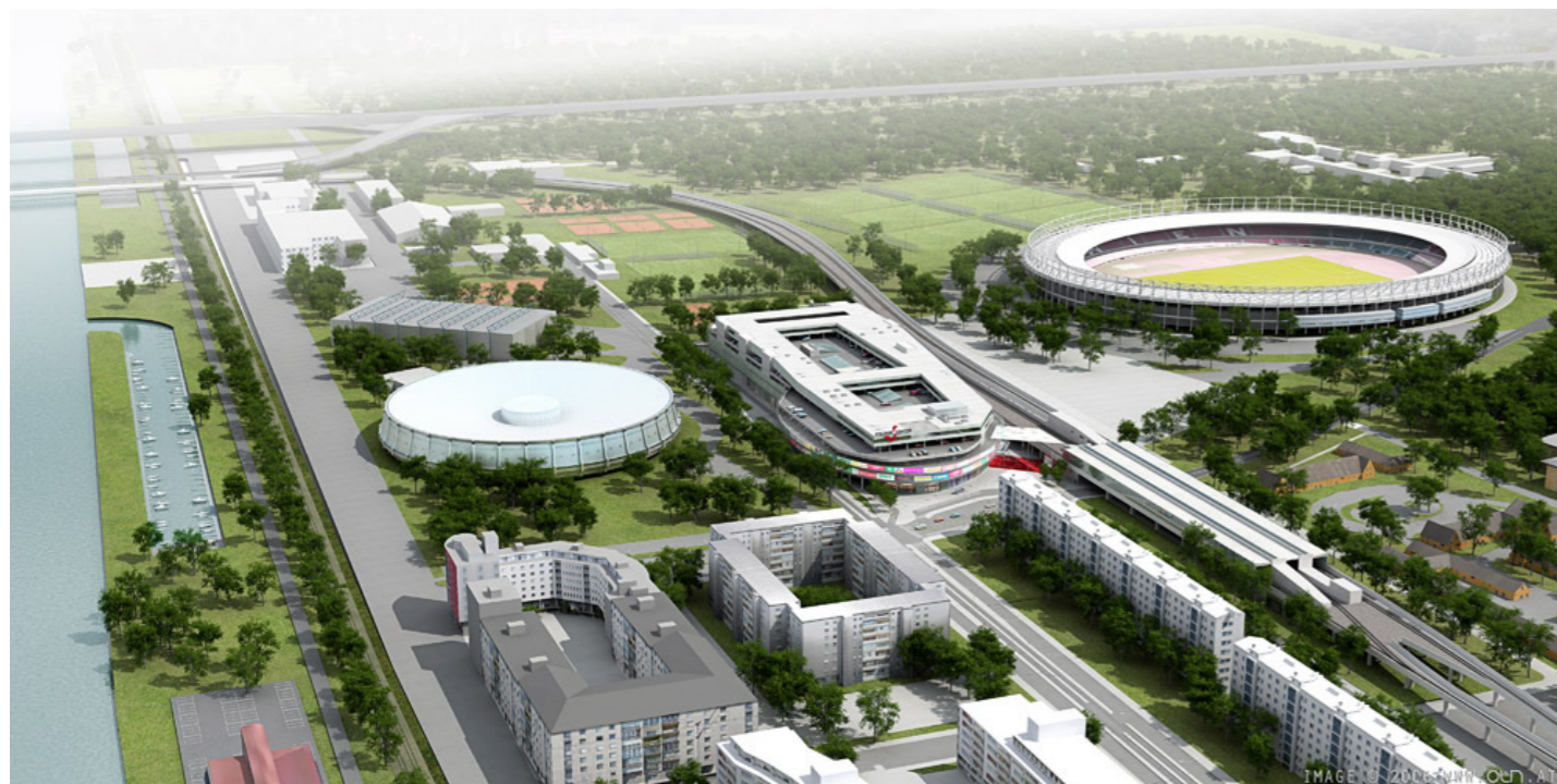
— Perspektive Vogelschau

In Zukunft steht dieser neu erschlossene, öffentliche Raum für Diversität von Aktivitäten, vom frühmorgentlichen, täglichen Einkauf über gemütliches Flanieren bis hin zur spannenden Übertragung sportlicher Grossereignisse an der Außenhaut. Das CCS wird zum zentralen Begegnungsort für unterschiedlichste Bevölkerungsgruppen. Dabei wird Themenschwerpunkt Sport in der Oberflächengestaltung des Platzes und in der Mall aufgegriffen und über das Dach selbst in großen Distanzen sichtbar gemacht.