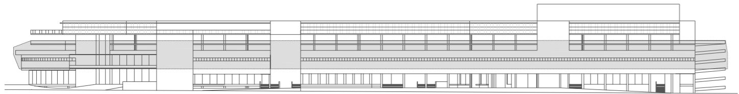
— Südwest Ansicht